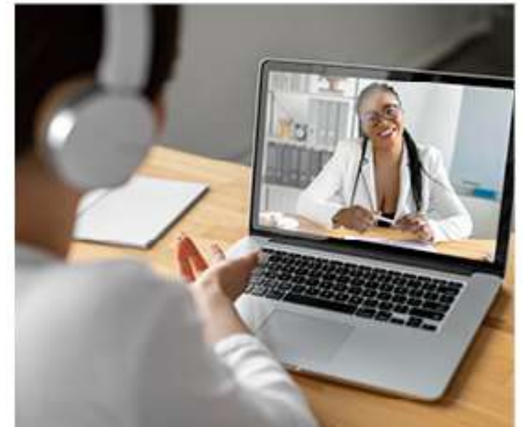
Consultas ilimitadas, 24h por dia: clínico geral, pediatria, orientação psicológica e nutricional ao seu alcance

Para conhecer mais detalhes sobre o plano ou sobre outras soluções oferecidas pela CDL Manaus em parceria com o SPC Brasil, entre em contato pelos números (92) 99371-2122, (92) 98643-2672 ou pelo telefone fixo 3627-2855. Nossa equipe está pronta para esclarecer dúvidas, apresentar benefícios exclusivos e orientar o empresário em cada etapa. A CDL Manaus permanece ao seu lado, trabalhando para fortalecer o desenvolvimento da sua empresa, ampliar oportunidades e garantir que você ofereça sempre o melhor para quem faz parte da sua trajetória.