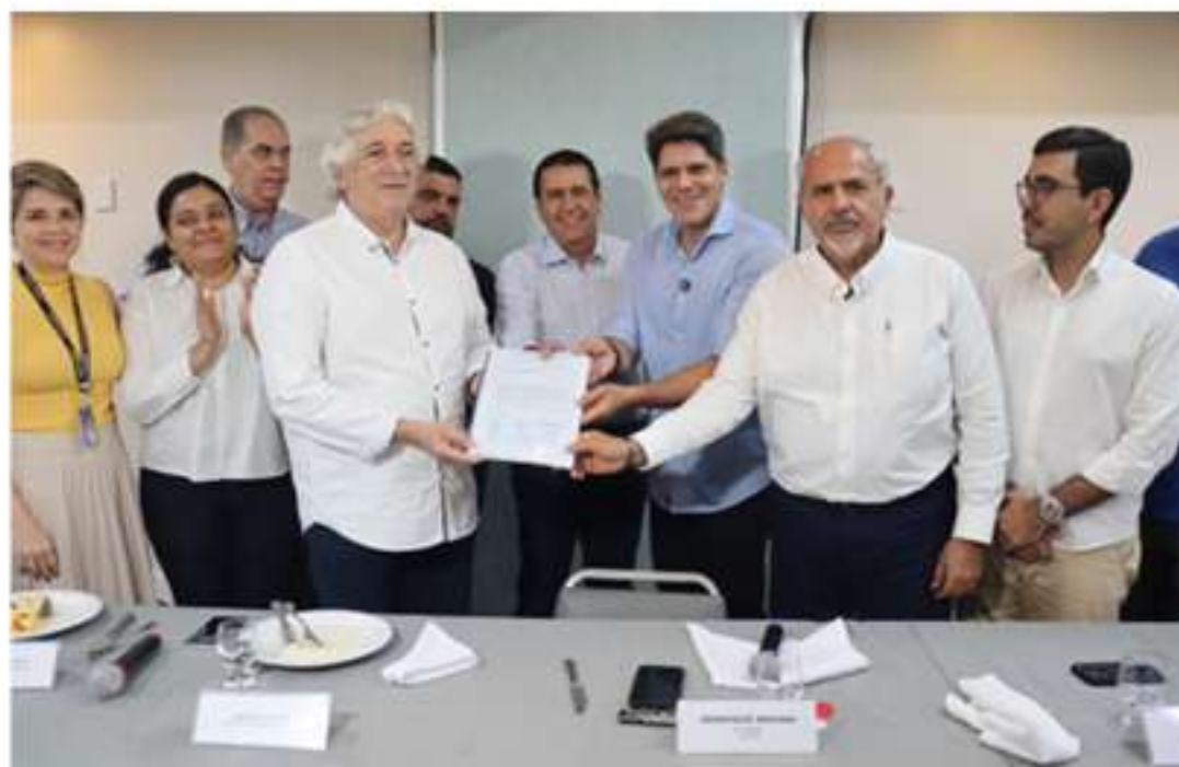
A iniciativa reforça as ações em andamento para a revisão do Plano Diretor de Manaus, instrumento essencial para orientar o crescimento urbano e promover uma cidade mais organizada

O material entregue foi produzido ao longo de meses de encontros, oficinas presenciais, reuniões virtuais e integração entre setor produtivo, entidades profissionais e órgãos públicos. O documento também reúne análises de legislações de outras capitais brasileiras, como