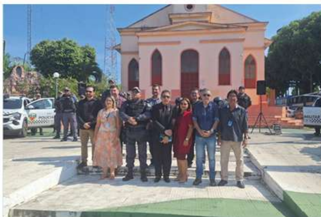
A operação teve como principal objetivo garantir mais paz, ordem e segurança à população de Manacapuru durante as festividades de fim de ano

Também participaram da solenidade o Tenente-