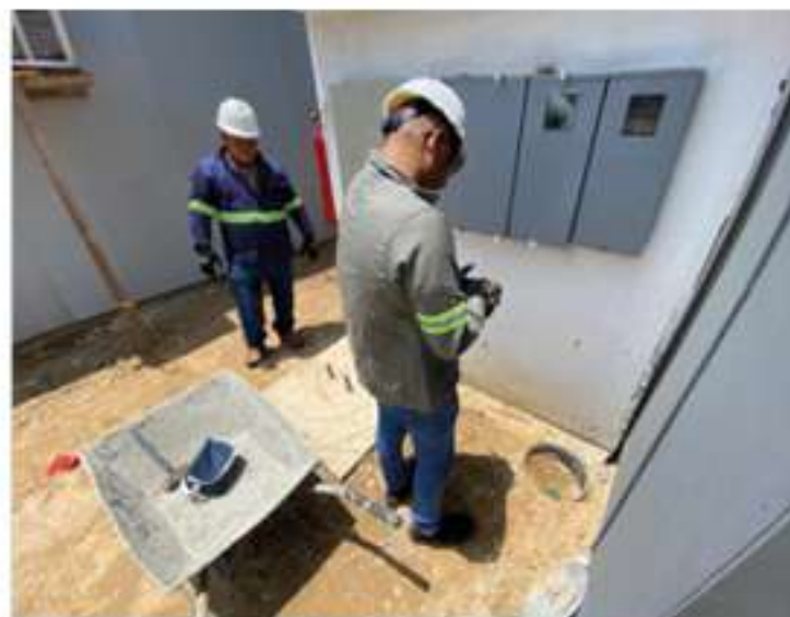
Instalação e ajustes em painéis elétricos em área externa, seguindo normas de segurança e garantindo a eficiência das operações no local. A atuação garante maior eficiência e confiabilidade