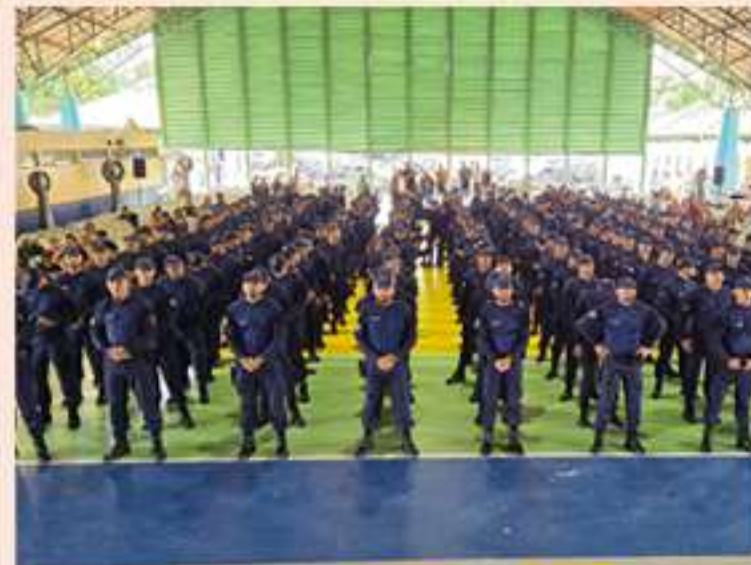
Além da renovação da frota, parte do investimento foi aplicada na compra de equipamentos essenciais à atuação dos guardas, reforçando a estrutura necessária para o atendimento de ocorrências

Com o investimento, a Guarda Municipal de Manaus passou a contar com melhores condições de trabalho e maior suporte para desempenhar sua missão, refletindo diretamente em mais segurança e presença efetiva nas ruas da capital.