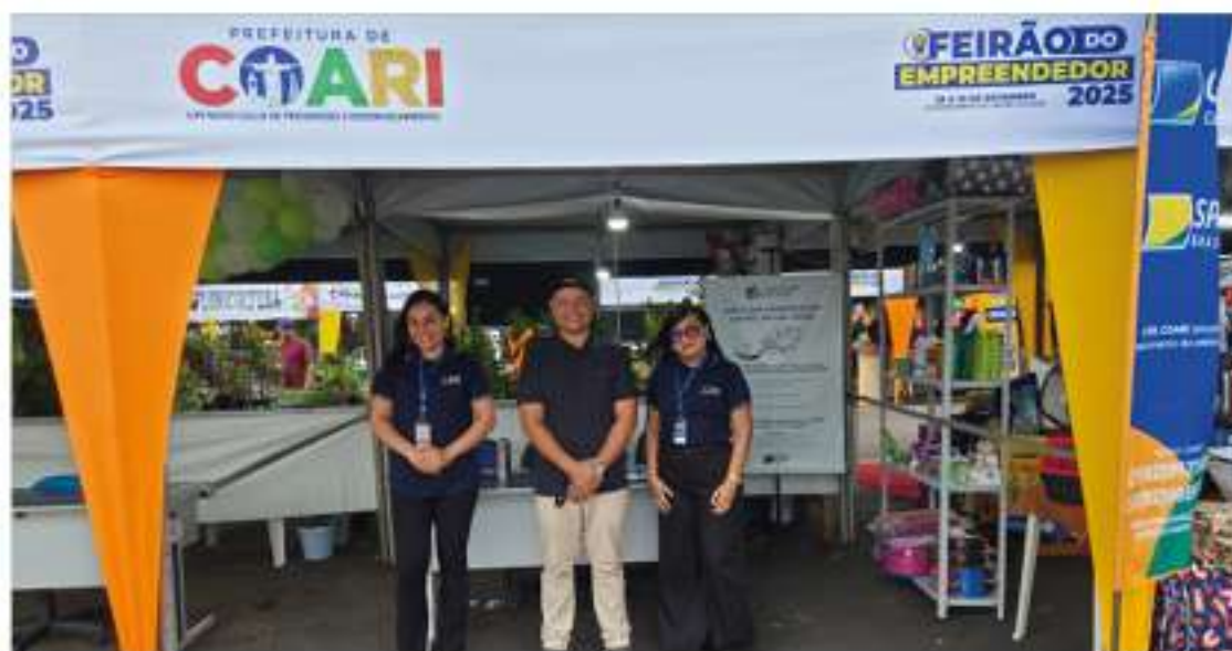
A CDL Coari realizou e ofertou certificado digital a empresários participantes do evento, além de outros serviços

O prefeito também promoveu a assinatura do protocolo de intenções