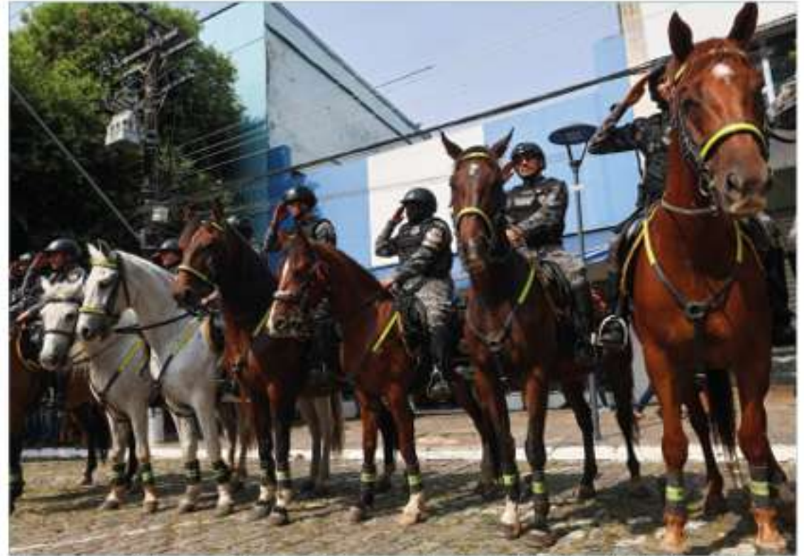
O governo mobilizou um efetivo ampliado de aproximadamente 1.600 policiais, além da incorporação de 500 alunos-soldados que passaram a atuar nas ruas como parte de sua formação prática