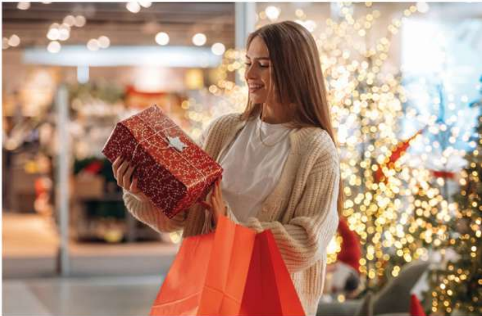
A nova pesquisa revela que 78% dos consumidores pretendem comprar presentes neste Natal, movimentando o comércio