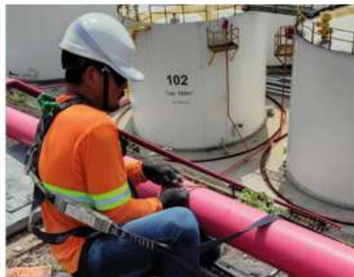
Técnico da VENC realiza serviços de instalação elétrica em área industrial, seguindo protocolos de segurança e garantindo a operação adequada das estruturas do local