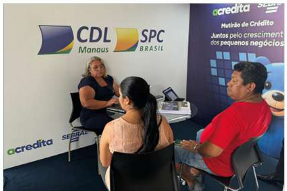
A iniciativa tem como foco beneficiar Microempreendedores Individuais, Microempresas e Empresas de Pequeno Porte conectando empreendedores a instituições financeiras e parceiros estratégicos

A ação contou com a presença de diversas instituições financeiras, como Caixa Econômica Federal, Banco do Brasil, Banco da Amazônia, Sicredi, Sicoob, Afeam, Cresol, SPC e Serasa, que realizaram análises e apresentaram propostas.