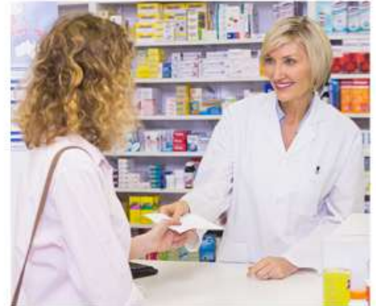
Economia de até 38% na compra de medicamentos em redes credenciadas em todo o país

Ao escolher a CDL Saúde, você demonstra responsabilidade com sua equipe e fortalece uma cultura organizacional.