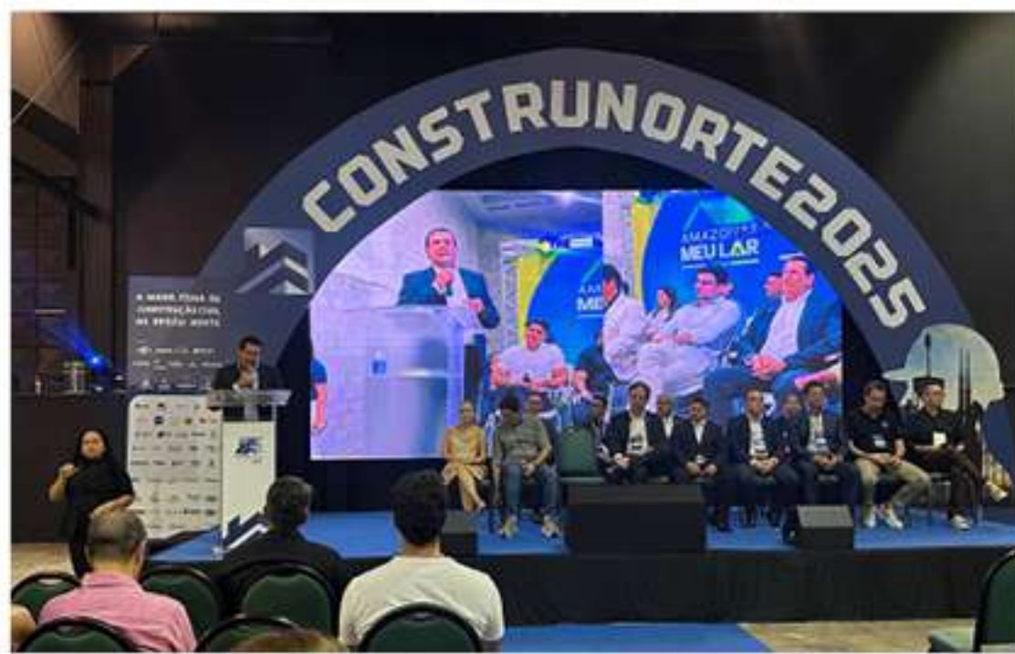
Com estandes distribuídos em módulos de nove metros quadrados, a feira recebeu um público formado por gestores de obras, arquitetos, engenheiros, projetistas, varejistas, atacadistas e outros

Entre os dias 12 e 14 de novembro, a Câmara de Dirigentes Lojistas de Manaus (CDL Manaus) participou da CONSTRUNORTE 2025, considerada a maior feira da construção civil do Norte do Brasil, realizada no Studio 5 Shopping e Convenções. O evento marcou o retorno de uma das principais vitrines do setor na região, reunindo mais de 100 expositores, entre startups, grandes indústrias nacionais e locais, entidades de classe, incorporadoras, institui-