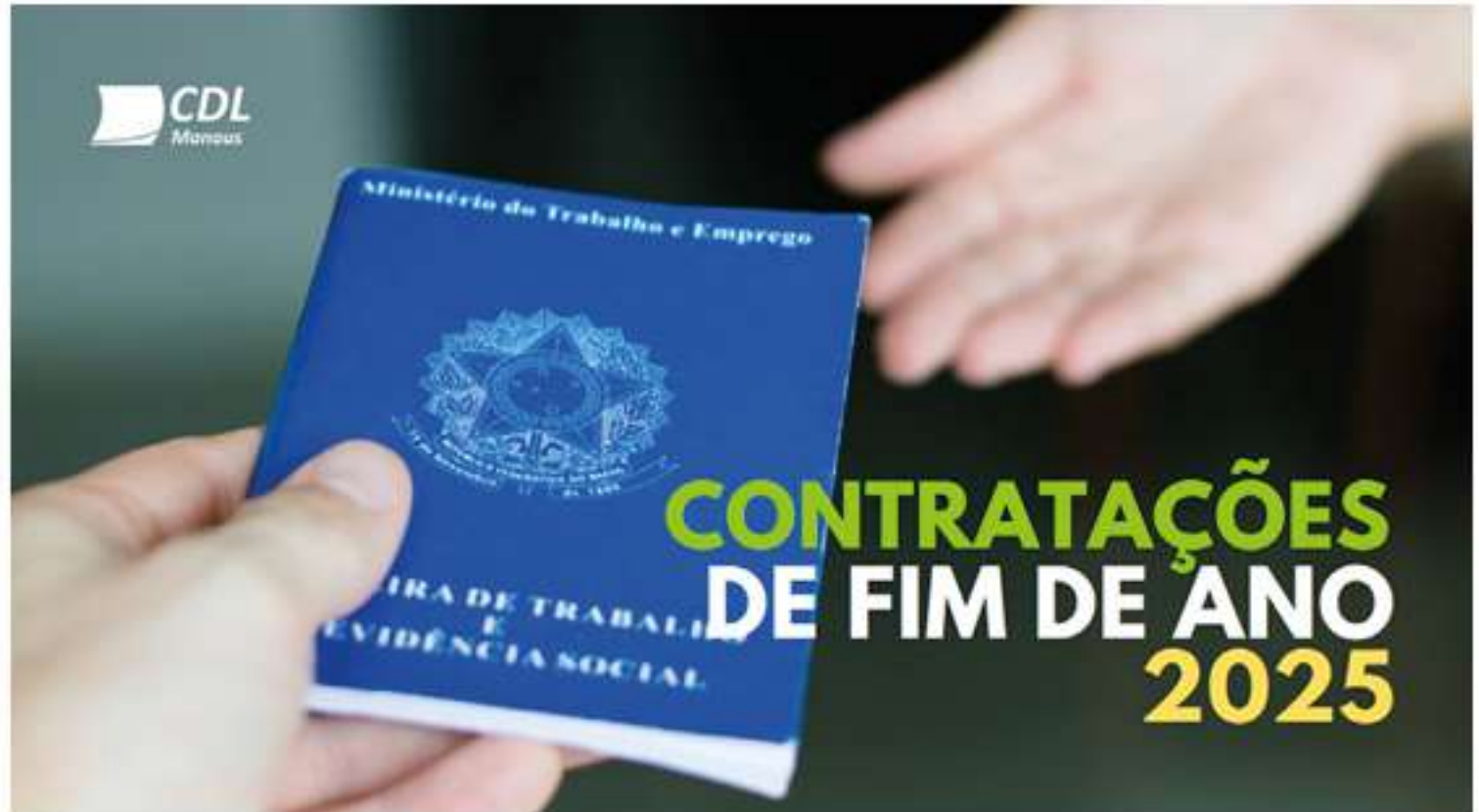
Manaus deve abrir 4.100 vagas temporárias no fim de 2025, segundo levantamento da CDL Manaus. O número supera o do ano passado e reforça o aquecimento do comércio para o período natalino

Os segmentos que lideram a demanda por trabalhadores temporários incluem confecção, sapataria, supermercados, lojas de brinquedos, lojas de eletrônicos e varejo de artigos de armarinhos.