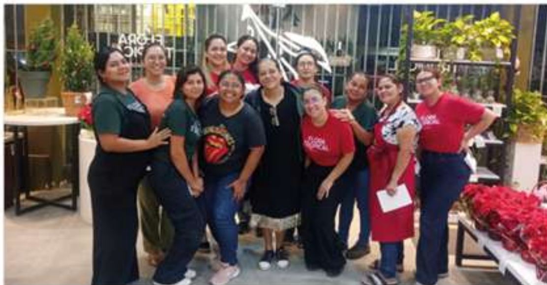
Colaboradoras da Agro Flora participantes do curso de Layout de Loja realizado pela UTV

aprenderam sobre organização estratégica de espaços, circulação de clientes, zoneamento de produtos, ambientação, comunicação visual e pontos de destaque que influenciam o comportamento do consumidor. A instrutora demonstrou como ajustes simples podem impactar diretamente o tempo de permanência do cliente, zoneamento de produtos, ambientação, comunicação visual e pontos de destaque que influenciam o