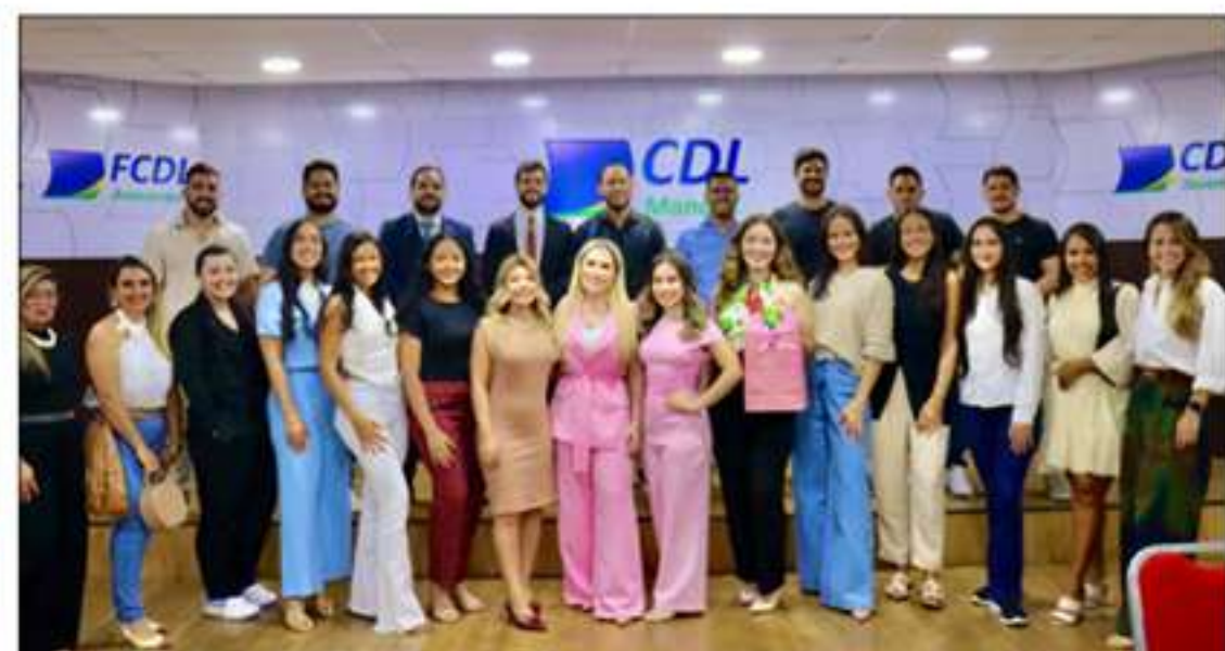
Membros da CDL Jovem e convidados que participaram da reunião realizada no auditório O Lojista

A empresária também compartilhou a criação da primeira versão da Nay Vieira Store, inaugurada em 06 de agosto de 2017, em um espaço simples atrás da loja do esposo. De lá para cá, a marca se expandiu e hoje conta com unidades em Porto Velho (matriz e filial), Ariquemes e Manaus, além de vender online para todo o Brasil. Ela atribui o crescimento da empresa a passos de fé,