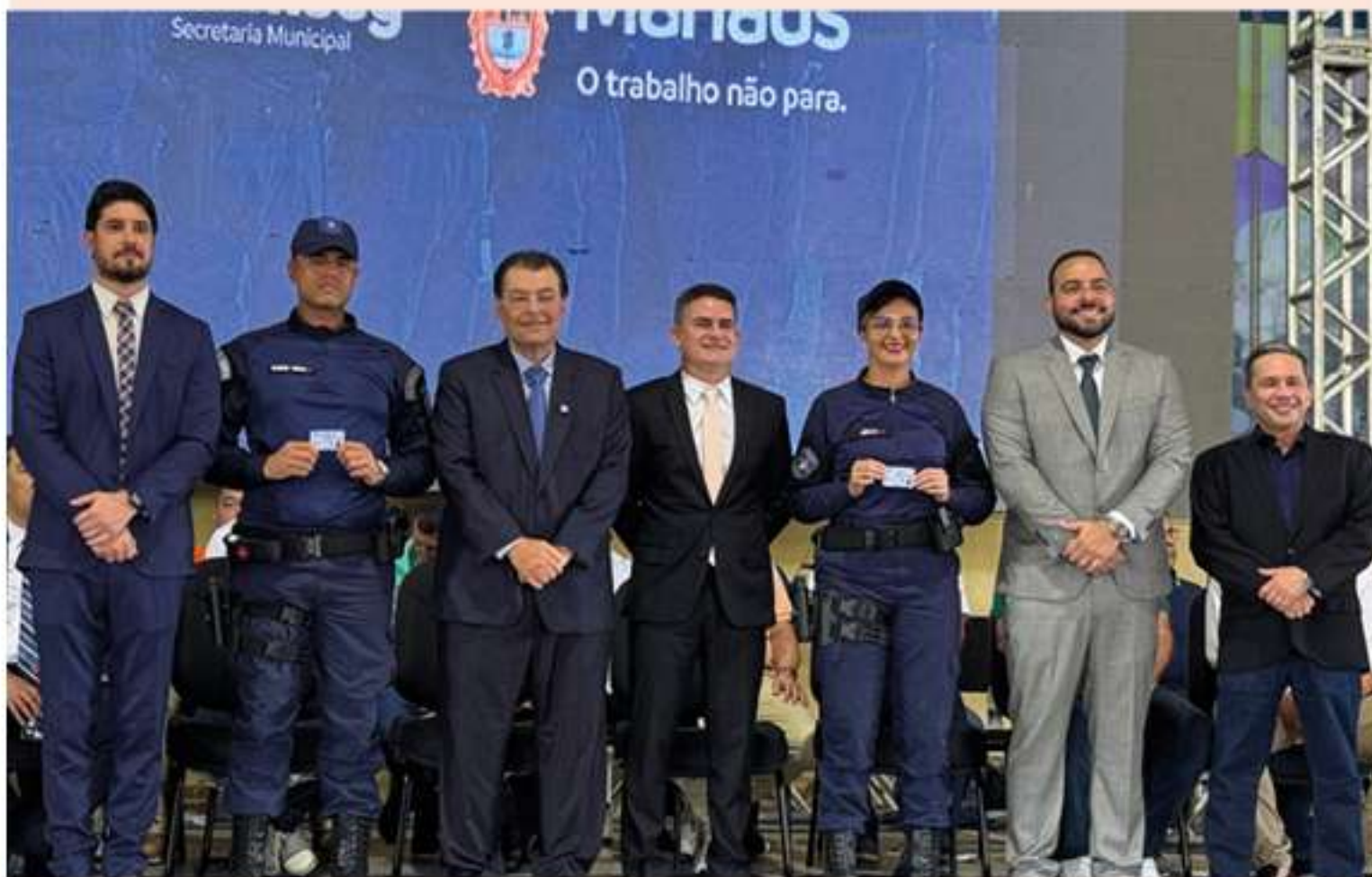
Com a verba, foram adquiridas novas viaturas, motocicletas e quadriciclos, ampliando significativamente a frota disponível para patrulhamento

Investimento permitiu a compra de viaturas, motos, quadriciclos e equipamentos que fortaleceram toda a estrutura da Guarda Municipal e ampliaram a atuação da corporação na capital