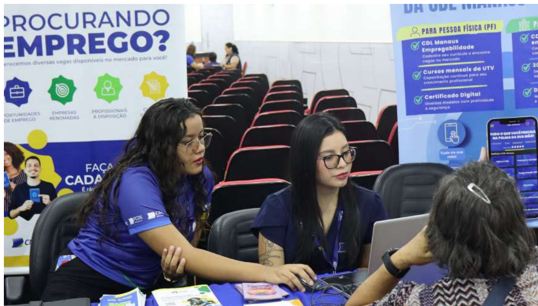
Atendimentos voltados à empregabilidade foram realizados durante a Operação Impacto, com orientação profissional e apoio na busca por vagas no mercado de trabalho.

Iniciativa realizada na sede da CDL Manaus promoveu cidadania, empregabilidade, saúde e orientação profissional a colaboradores do comércio da capital amazonense