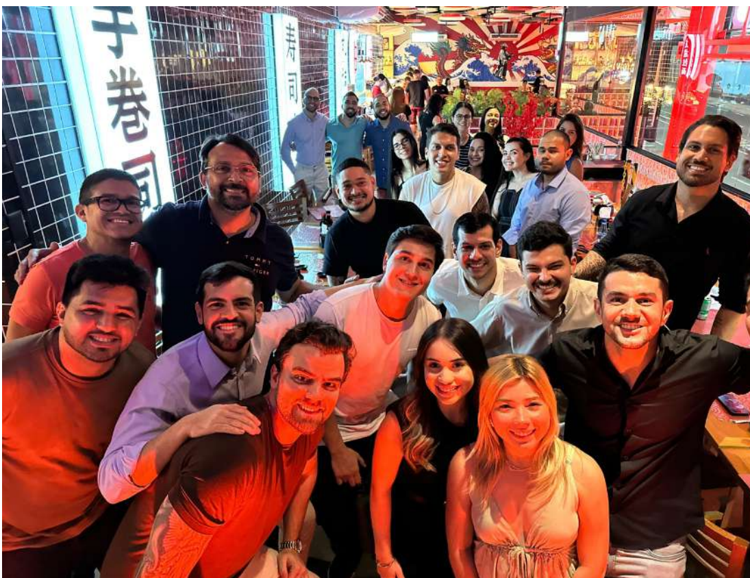
Empresários e lideranças da CDL Jovem Manaus durante o Happy Hour empresarial realizado no restaurante YuGo Sushi, promovendo networking e troca de experiências.