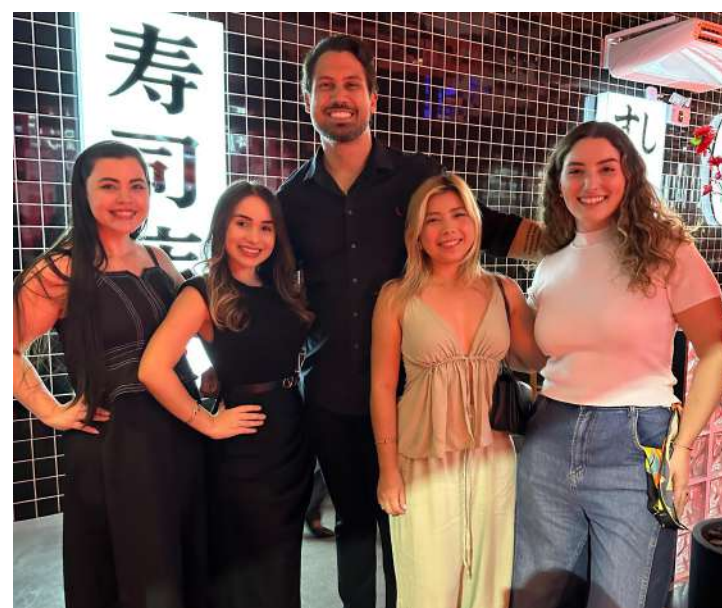
Integrantes da CDL Jovem Manaus se reúnem para fortalecer conexões e discutir desafios e oportunidades do empreendedorismo na capital.

participantes. "Mesmo quando o negócio é de um segmento diferente do nosso, conseguimos tirar insights valiosos para aplicar em nossas empresas. Estar em um ambiente de troca e aprendizado contribui diretamente para o crescimento de quem está iniciando ou consolidando sua trajetória no empreendedorismo", destacou.