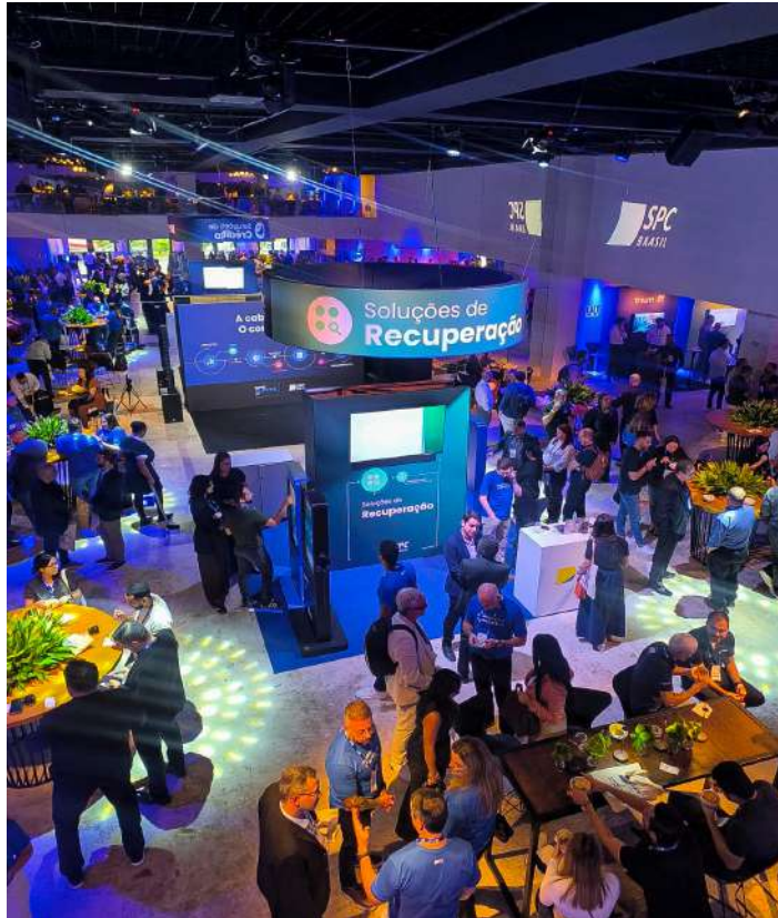
Especialistas reunidos para debater inovação e estratégias que estão transformando o crédito no Brasil.

dados estiveram: crédito como ferramenta estratégica de relacionamento e geração de receita; uso de inteligência artificial, modelos preditivos e dados alternativos; monitoramento contínuo da carteira; cobrança personalizada e orientada por dados; estratégias para vender mais com segurança.