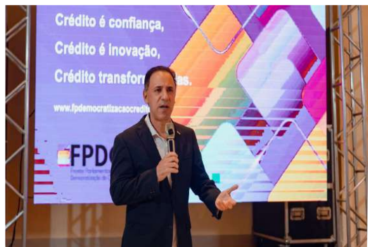
União de lideranças em defesa do crédito responsável, ampliando oportunidades para o comércio e impulsionando o desenvolvimento econômico.

A presença da CDL Manaus no evento reforça o papel da entidade no apoio a iniciativas que estimulam o crédito sustentável, fortalecendo o setor empresarial e ampliando oportunidades para o Amazonas.