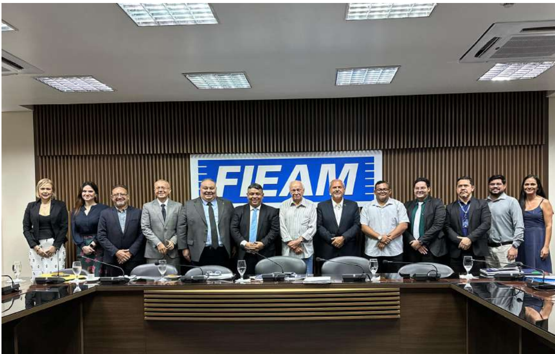
Lideranças empresariais e institucionais se reuniram na sede da FIEAM para discutir estratégias e alinhar ações voltadas ao desenvolvimento econômico do Amazonas.

Entre os principais pontos da pauta esteve a apresentação da nova presidência e dos novos diretores da AADESAM, além da exposição de temas relacionados à gestão administrativa e financeira da instituição. Foram discutidos assuntos como prestação de contas, certificações institu-