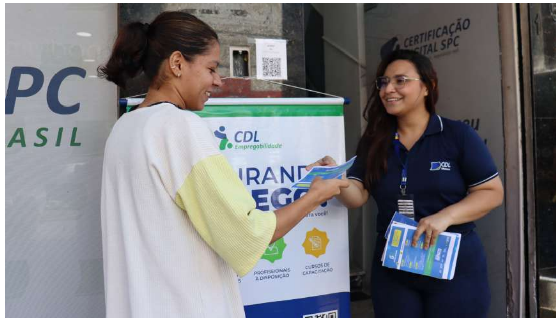
Ação levou serviços gratuitos aos comerciantes do Centro de Manaus, incluindo orientação, acesso a benefícios e iniciativas de apoio ao comércio local.

Mais de 1,5 mil atendimentos foram realizados durante a primeira edição do Centro Cidadão, ação coordenada pela Secretaria de Estado de Justiça, Direitos Humanos e Cidadania (Sejusc) em parceria com a Câmara de Dirigentes Lojistas de Manaus (CDL Manaus). A iniciativa ocorreu na sede da entidade, no Centro da capital, e teve como foco principal atender colaboradores do comércio da região, oferecendo serviços de cidadania, saúde e acesso a programas sociais.