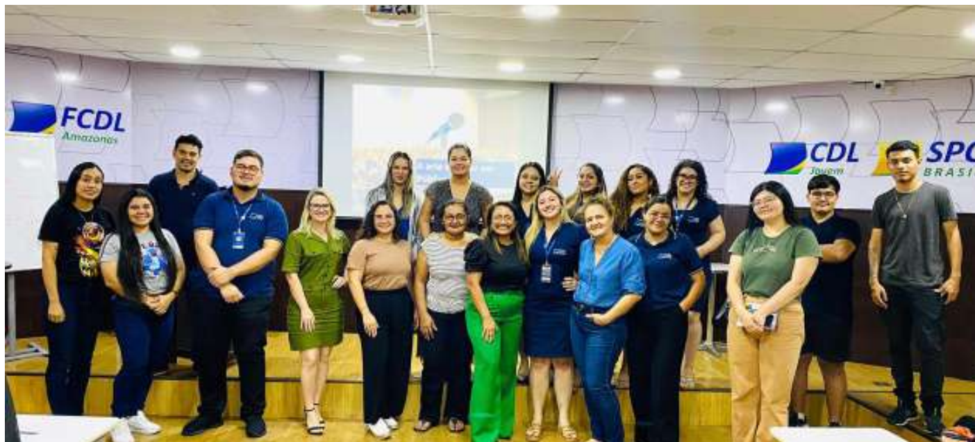
Participantes do curso Oratória: A Arte de Falar em Público, da CDL Manaus, desenvolvem técnicas de comunicação, autoconfiança e posicionamento profiss

Curso de Oratória desenvolve pela Universidade do Varejo destaca a importância da comunicação no mercado