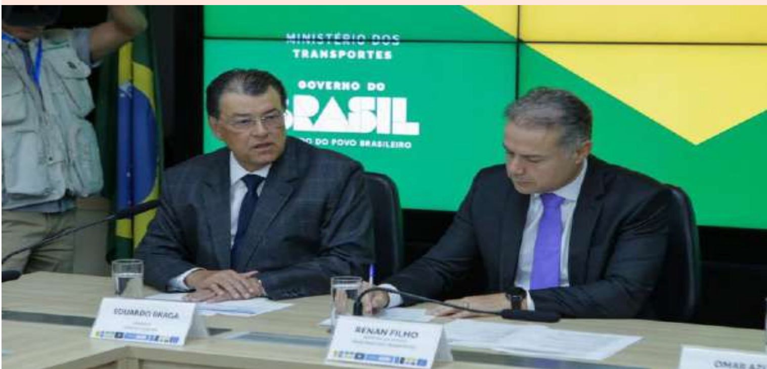
O senador Eduardo Braga e o ministro dos transportes, Renan Filho, acompanhando de perto os avanços da BR-319, cuja pavimentação do trecho do meio ganha impulso com nova emenda destinada à obra.

Recurso assegura avanço da licitação e impulsiona projeto estratégico para a integração e o desenvolvimento da Amazônia