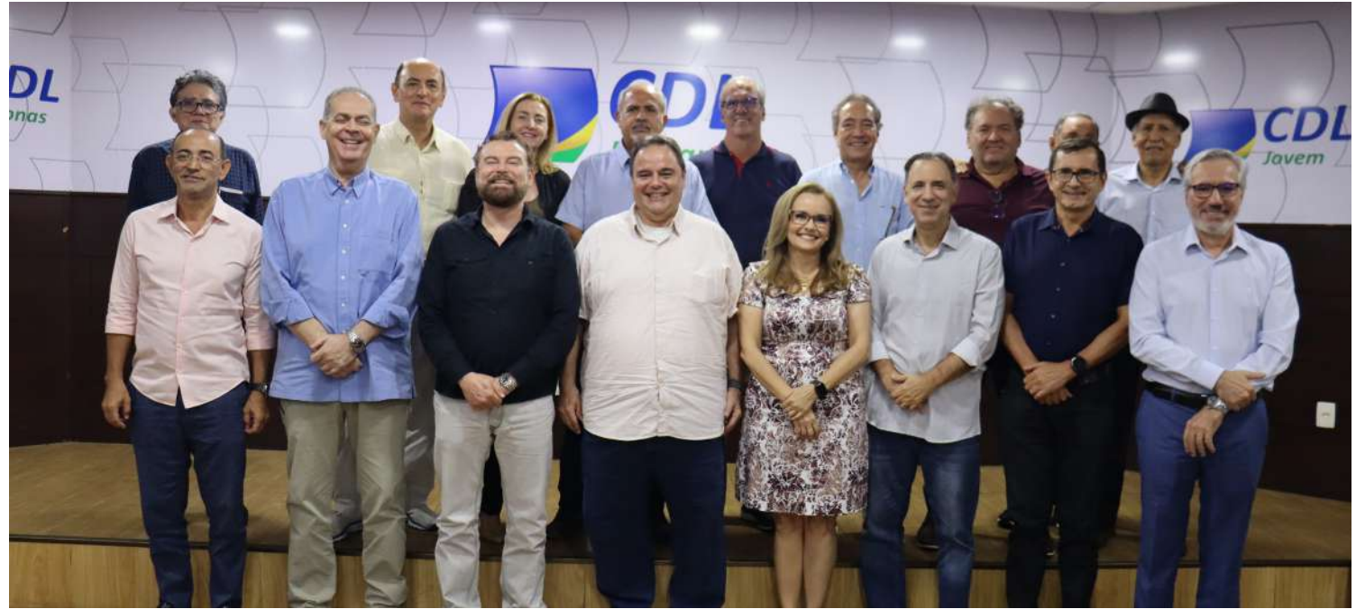
Reunião de diretoria marca o início do planejamento estratégico das entidades, com foco em novos serviços e crescimento do setor lojista.

Primeira reunião de diretoria destaca inovação, novos serviços e ações para fortalecer lojistas e impulsionar a economia